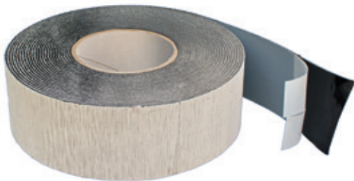
Lengte: 10 m Breedte: 60 mm