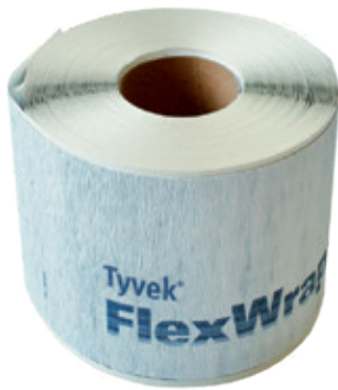
Lengte: 23 m Breedte: 15 cm

Flexibele, hoogperformante tapes voor luchtdichte en waterdichte afdichtingen rond daken, plafonds en muurpenetraties